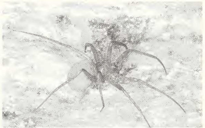
Abb. 1: Zimiris doriai Simon, 1882, eingeschlepptes Weibchen, Köln. Beachte die nach vorne verlagerten lateralen vorderen Spinnwarzen und die drei hell scheinenden Nebenaugen.

Verbreitung: Nach PLATNICK & PENNEY (2004) ist die Art in Indien, Indonesien (Java), Malaysia, Elfenbeinküste, Sudan, Jemen, Eritrea, Französisch-Guyana, Kuba, Mexiko und in der Dominikanischen Republik verbreitet. Der Container, aus dem die eingeschleppten Tiere stammen, kam aus Vietnam, d.h. er war dort beladen worden. Es ist